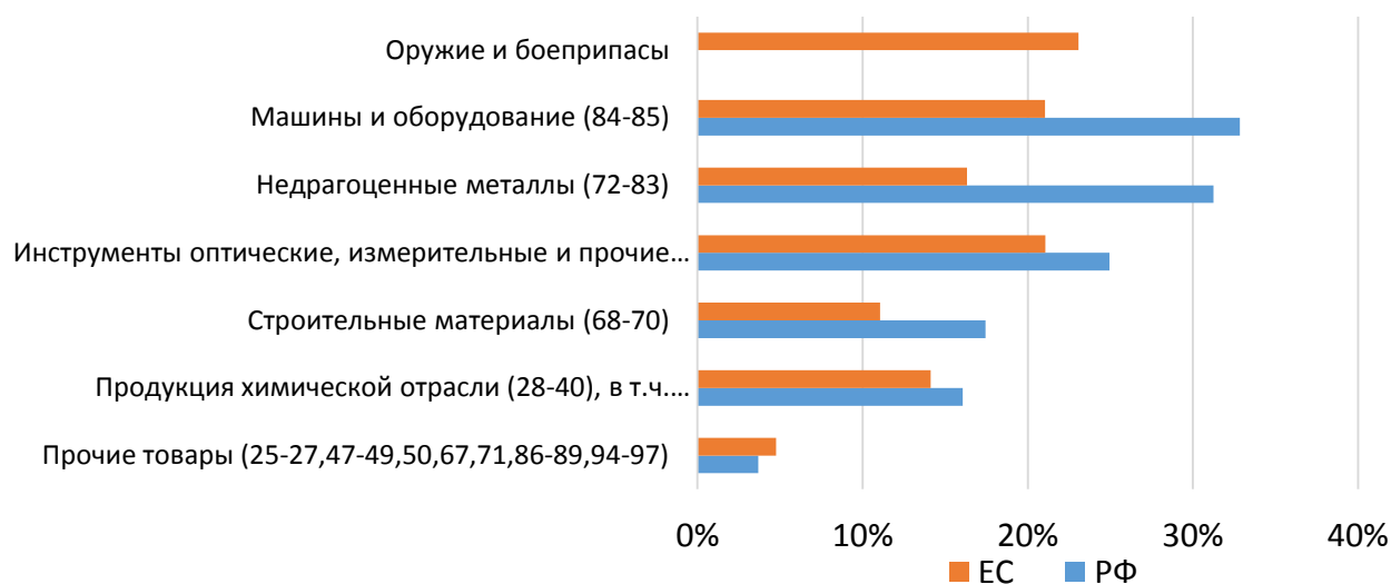
Рисунок 3. Доля продукции, которая подпадает под экспортный контроль (по основным категориям товаров)