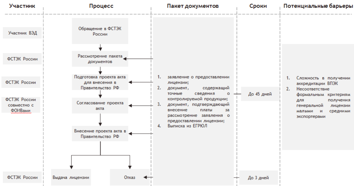
Рисунок 5. Схема получения генеральной лицензии ФСТЭК России

Источник — Приказ ФСТЭК России от 04.05.2012 № 51, опрос участников ВЭД