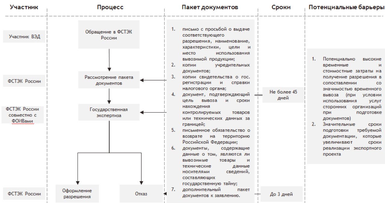
Рисунок 6. Схема получения разрешения Комиссии по экспортному контролю на временный вывоз